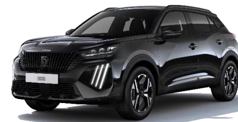
Negro Perla Nera