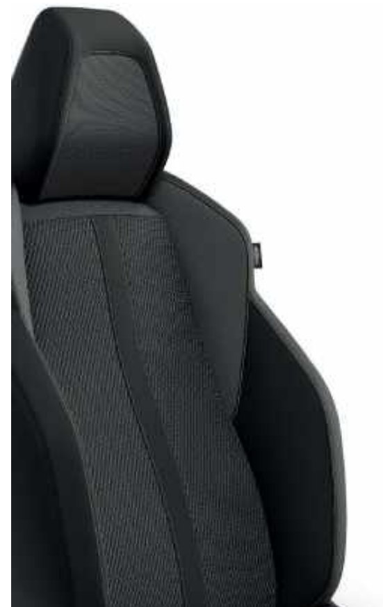
Guarnecido principal BELOMKA acompañamiento trimateria 'Uni Capy' y TEP. Costuras verde Adamite