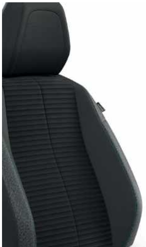
Leorki, trimatería chiné, acompañamiento en Rimini y costuras Calcita