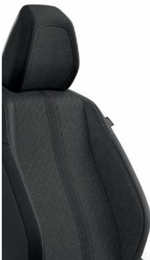
'Casual Lomsa 45' con acompañamiento trimatería TEP y pespunte 'Quartz'